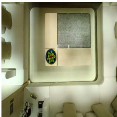
TABLE RÉALISÉE PAR BERNARD PICTET POUR LE YACHT ZÉFIRA - ARCHITECTE RÉMI TESSIER