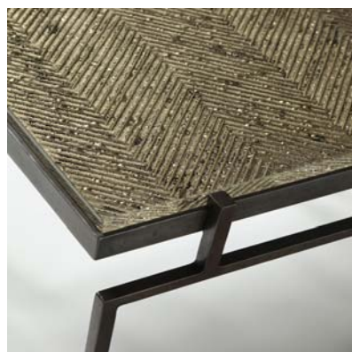
TABLE "SCARABÉE" CRÉÉE PAR VINCENT CORBIÈRE ET ATELIER BERNARD PICTET/ PHOTOGRAPHIE BASTIAAN VAN DEN BERG.