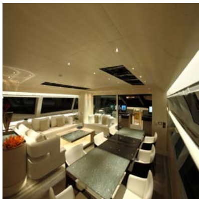
TABLES RÉALISÉES PAR BERNARD PICTET POUR LE YACHT ZÉFIRA - ARCHITECTE RÉMI TESSIER

En l'espace de deux ans, Rémi Tessier et Bernard Pictet ont collaboré à la réalisation d'une dizaine de projets.