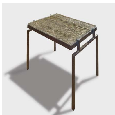
TABLE "SCARABÉE" CRÉÉE PAR VINCENT CORBIÈRE ET ATELIER BERNARD PICTET/ PHOTOGRAPHIE BASTIAAN VAN DEN BERG.

Réalisé en quatre exemplaires ce beau meuble sert de table d'appoint.