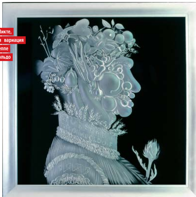
Бернар Пикте, стеклянная вариация на тему Джузеппе Арчимбольдо