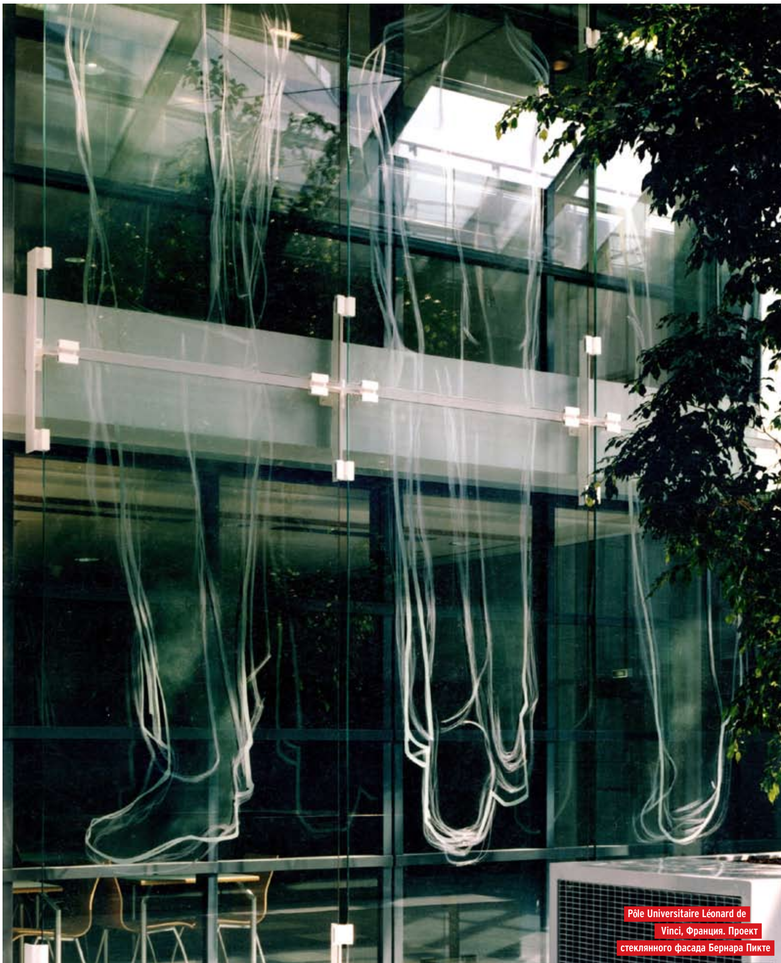
Pôle Universitaire Léonard de Vinci, Франция. Проект стеклянного фасада Бернара Пикте