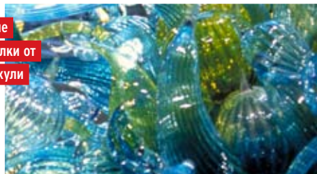
Стекланные потолки от Дейла Чихули