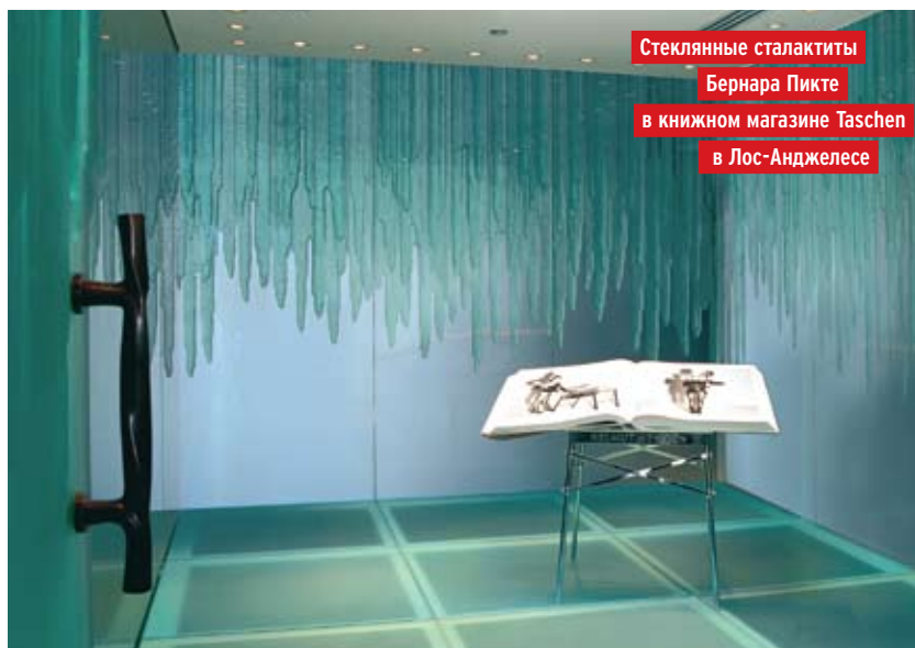
Стеклянные сталактиты Бернара Пикте в книжном магазине Taschen в Лос-Анджелесе

Бернар Пикте верен принципам высокой моды. Среди его заказчиков — королевские семьи Марокко, Саудовской Аравии, мировые бренды от Chanel до Louis Vuitton и современные художники. Он воплощал в жизнь самые экстравагантные фантазии архитекторов и дизайнеров. Воспроизводил на стекле рисунки восточных ковров, наносил металлическое покрытие на витрины парижско-