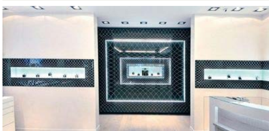
Studio Bernard Pictet, Quantum Glass

Verre cinétique "Mondrian" pour une cabine d'ascenseur.