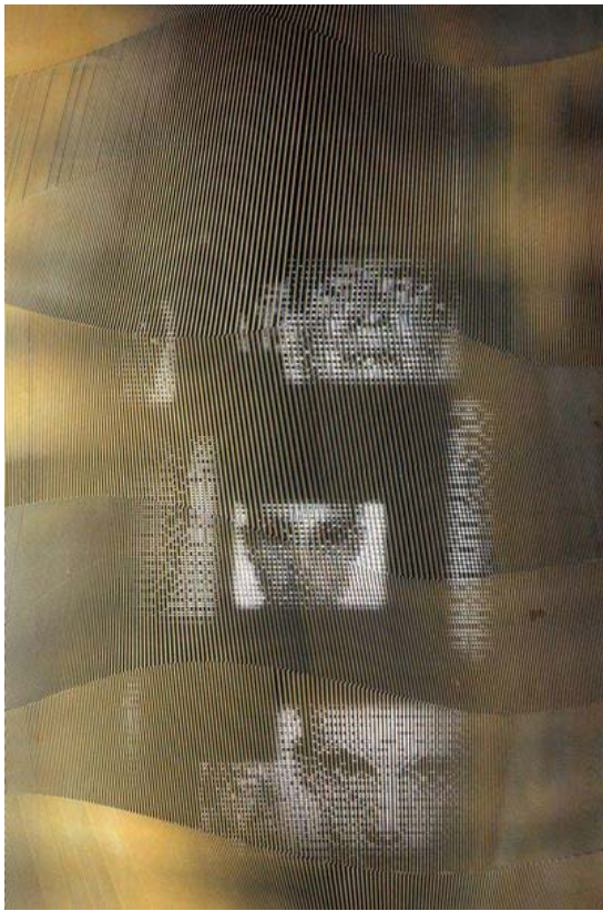
Studio Bernard Pictet