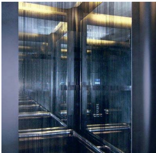
Studio Bernard Pictet, Quantum Glass

Echantillons de verre gravé, éclaté au burin, argenté, doré, sablé, traité à l'acide ou cinétique, réalisés dans l'atelier de Bernard Pictet.