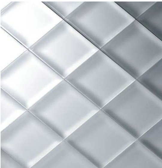
Studio Bernard Pictet

Echantillons de verre gravé, éclaté au burin, argenté, doré, sablé, traité à l'acide ou cinétique, réalisés dans l'atelier de Bernard Pictet.