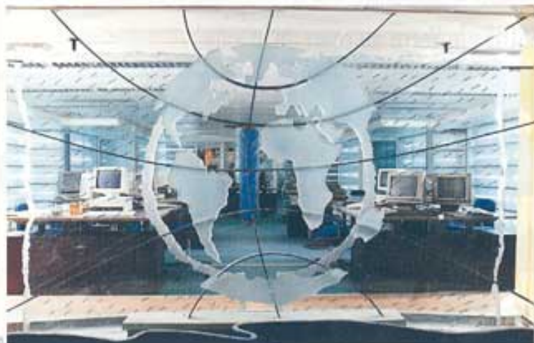
De gauche à droite : deux détails de l'hôtel du golf de Cély (F.-L. Perliassé, architecte d'intérieur), escalier de l'agence All Nippon Airways sur les Champs-Élysées à Paris (F. L. Perliassé, architecte d'intérieur), sculpture pour le hall d'une agence de voyage (Zoé-Vas, architecte d'intérieur). Cette sculpture, qui sépare la salle informatique du hall d'accueil est réalisée avec deux grands feuilletés de verre 10 + 8 avec des éclats argentés en aplats, découpés et gravés sur leur pourtour. Le tout est mis en dépôt d'une structure acier qui supporte les continents réalisés dans une dalle de 25 mm dont la découpe reçoit une finition en "joint gale".