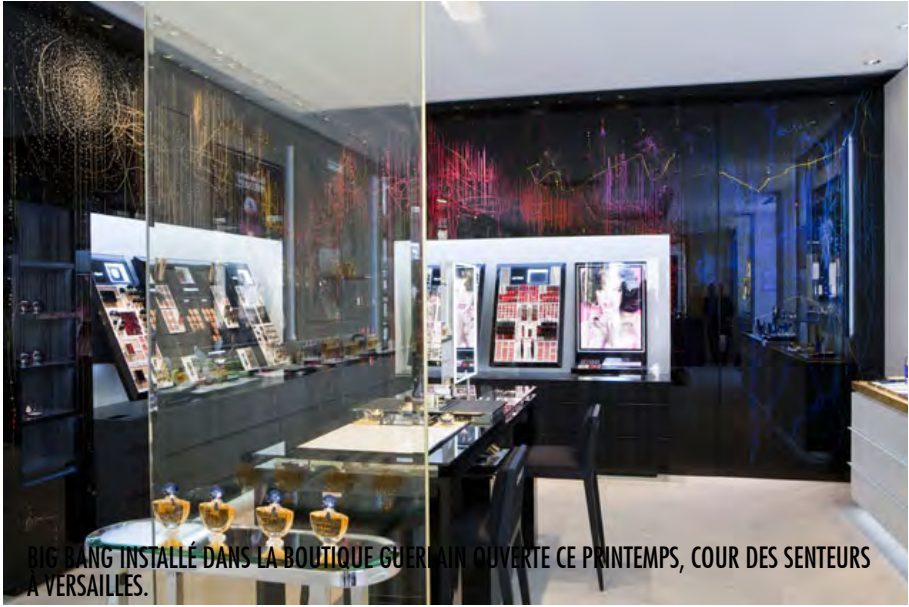
BIG BANG INSTALLÉ DANS LA BOUTIQUE GUERLAIN OUVERTE CE PRINTEMPS, COUR DES SENTEURS À VERSAILLES.