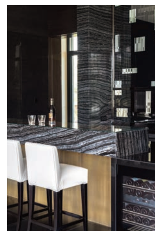
VIS A VIS