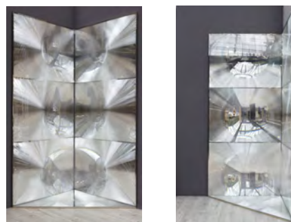
© ATELIER BERNARD PICTET SALON REVELATION HOMMAGE A KAPOOR PHOTOS ANAIS WULF