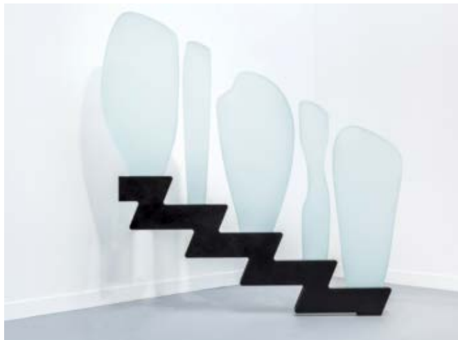
PROJET DE RAMPE D'ESCALIER