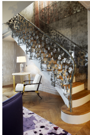
Réalisation Atelier Bernard Pictet - Architecte Brigitte Saby

Il s'harmonise parfaitement avec son environnement dont il reflète la lumière et les couleurs avec délicatesse.