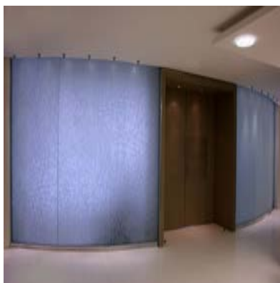
Диксенс. Перегородка Зала заседаний АХИТЕКТОР МИКАЭЛА ЛАЗАРИУ. МАСТЕРСКИЕ Б. ПИКТЕ