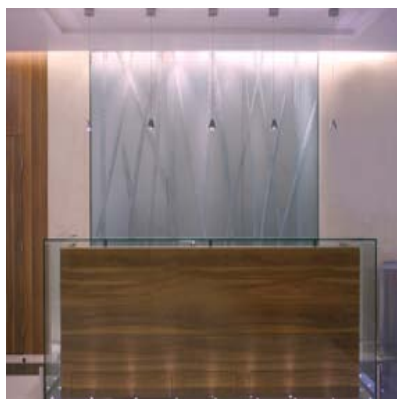
Диксенс, Стойка приемной. Мастерские Бернара Пиктеолы, изготовленные Бернаром Пикте

Компания «Диксенс Сожелен» выбрала для своего главного офиса парижскую улицу Бом и заказала архитектору Микаэле Лазариу концепцию архитектуры интерьера. Архитектор, в свою очередь, обратилась к Бернару Пикте для создания двух стеклянных произведений, которые бы придали помещению динамичность без агрессивности. Мягкая композиция, представляющая собой бамбуковые побеги, выполненные из посеребренного окисленного и обработанного резцом стекла мягко оживляет стену за Стойкой Приемной.