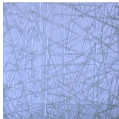
ДИКСЕНС. Перегородка Зала заседаний АХИТЕКТОР МИКАЭЛА ЛАЗАРИУ. МАСТЕРСКИЕ Б. ПИКТЕ

Мастерские Бернара Пикте постоянно сотрудничают с архитекторами, предлагая свои оригинальные стеклянные произведения для оформления парадных помещений главных офисов крупных компаний – холлов, переговорных, кабинетов руководства.