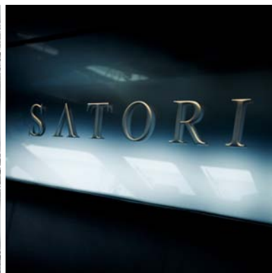
YACHT SATORI -GLACE WHEEL DECK-- ARCHITECTE : RÉMI TESSIER

БЕРНАР ПИКТЕ РЕГУЛЯРНО СОЗДАЕТ СТЕКЛЯННЫЕ АНСАМБЛИ ДЛЯ РОСКОШНЫХ ЯХТ.