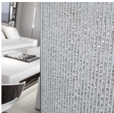
YACHT SATORI - PAROIS MURALES BOMBÉES - ARCHITECTE : RÉMI TESSIER