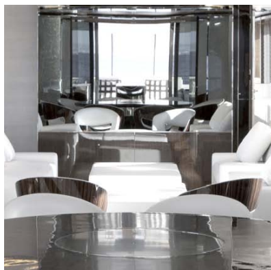
YACHT SATORI - PAROIS MURALES BOMBÉES - ARCHITECTE : RÉMI TESSIER

Для «Квинта Эссенция», 55-ти метровой яхты, получившей премию за дизайн 2011 года журнала «Yacht Design Magasin» были созданы лестничный пролет, стеклянные перегородки и двери, светящаяся мебель и потолочные светильники. Лестничный пролет площадью более 40 м2 имеет три уровня. Он выполнен из выпуклого, посеребренного стекла, гравированного на задней стороне и матового и окисленного на передней стенке в виде стилизованных сталактитов.