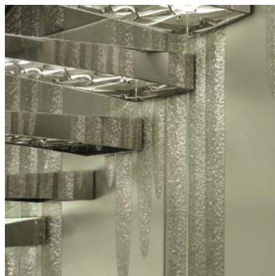
YACHT QUINTA ESSENTIA, -NAKHIMOV YACHTS.(AWARD MONACO SHOW 2011) - CAGE D'ESCALIER RÉALISÉE PAR BERNARD PICTET - ARCHITECTE MICHAELA REVERBERI- ECLATÉS AU BURIN ARGENTÉ SUR FOND MIRROR AODÉ