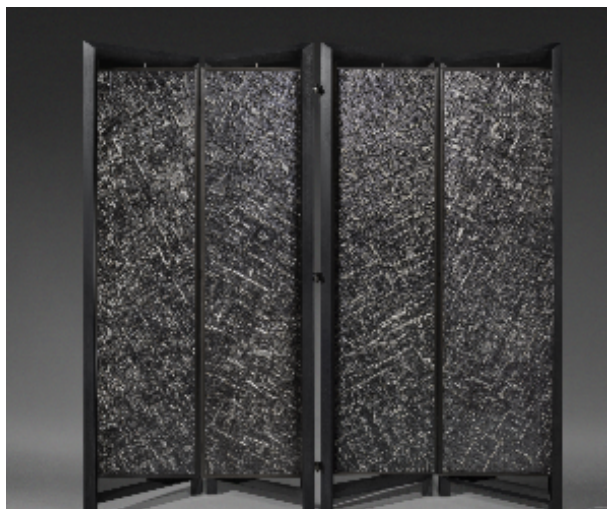
Ширма, общий вид.