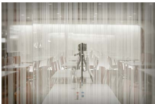
6/8 Осман : Отражение фотоаппарата показывает отражающие качества стекла – Архитектор 16К, Эльбер © Бернар Пикте

Жюльен Грено и Дидье Боннфуа из Агентства 16К обратились к АTELIER BERNARD PICTET с предложением принять участие в реализации проекта дизайна корпоративного ресторана, расположенного по адресу 6/8, бульвар Осман, Париж.