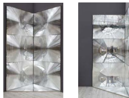
© Ателье Бернар Пикте. Салон «Откровение». В честь Капура. Фотография Анаис Вульф