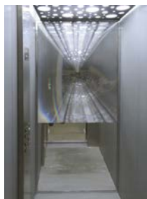
© Ателье Бернар Пикте. Оптический принцип в честном лифте.